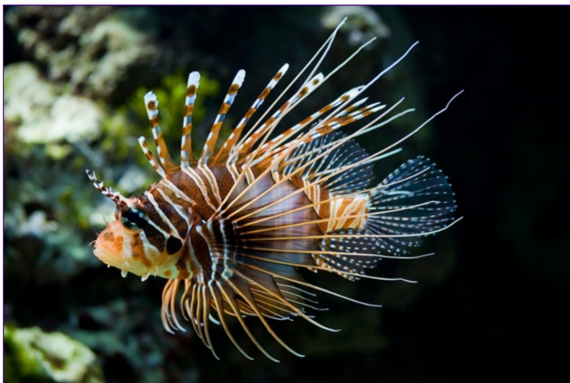
Figura 1. Pez León ( Pterosis volitans ).

Todos los peces de la familia Scorpoenidae son venenosos y pueden ser divididos en tres grupos que inyecta veneno en cantidad y potencia diferente. Las especies de pez león ( Pterois spp ) tienen las espinas dorsales relativamente delgadas y largas con glándulas más pequeñas que producen un veneno más débil (Figura 2).