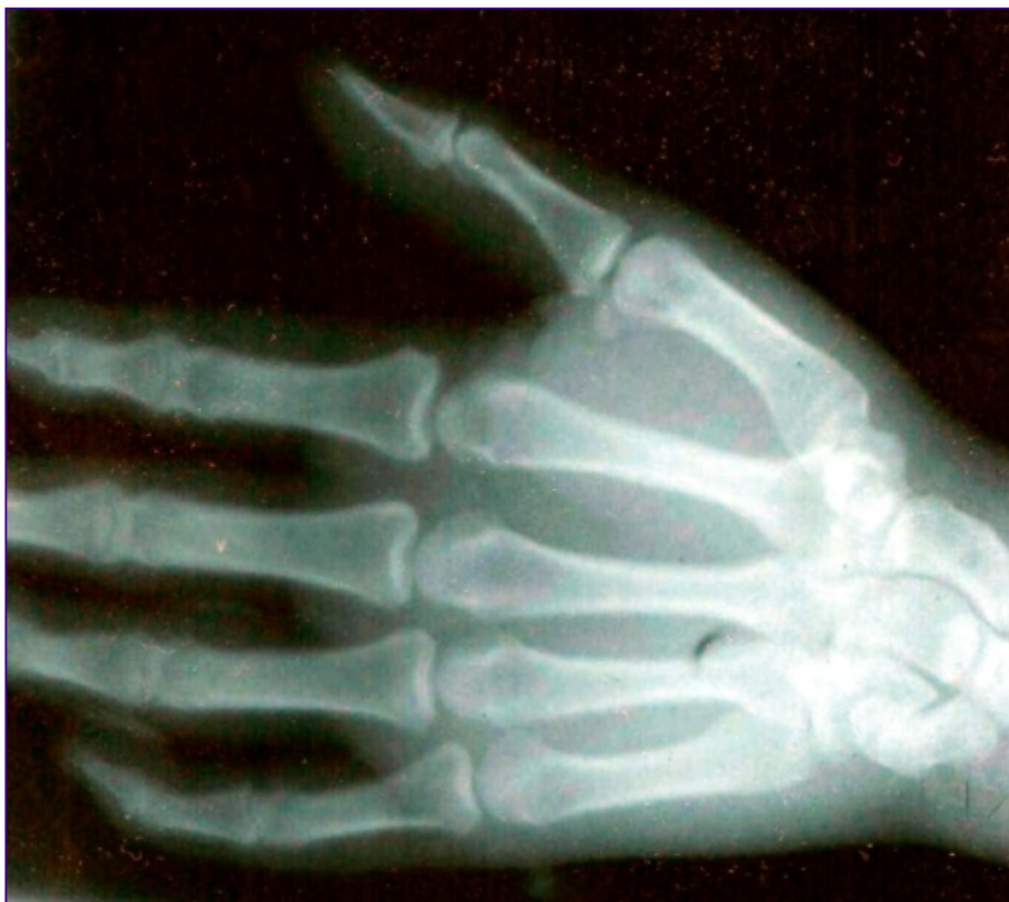
Figura 2. Radiografía de mano derecha. No se visualiza imagen radiopaca.

Dentro de los estudios realizados en el SU y durante se estancia en UCI solo resaltó el nivel de potasio (2.4 mmol/l) cifra que se normalizó en las siguientes muestras tomadas en UCI, el resto de los estudios de laboratorio y radiografía de la mano derecha fueron normales (Figura 2).