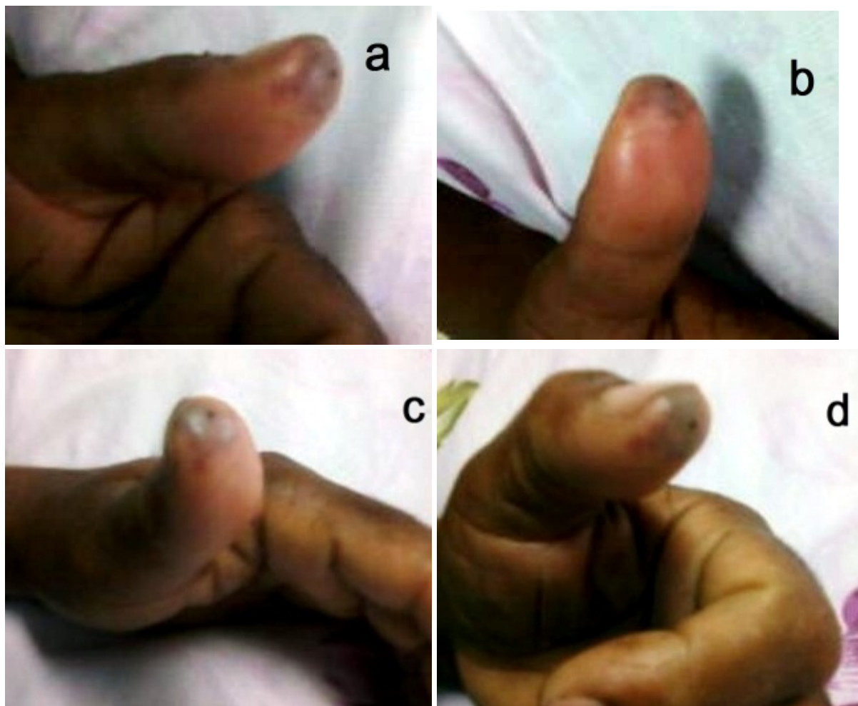
Figura 3. Lesión por picadura de Pez León. Fotos tomadas al tercer día de la lesión donde se observan: signos inflamatorios, edema y rubicundez (a y b) además de los encontrados al examen físico, dolor y calor; zona central de punción rodeada por una zona pálida a la que le sigue zona cianótica (c y d).

Se da el alta de la unidad al siguiente día y del hospital al octavo día totalmente recuperado y sin necesidad de haber realizado ninguna intervención sobre la lesión distinta a las curaciones.