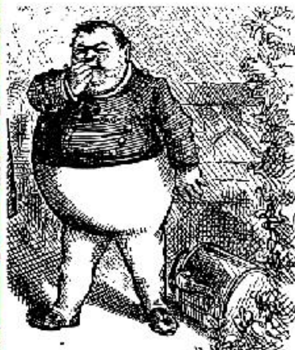
Portada de «The posthumous paper of the Pickwick Club» de Charles Dickens y primer plano de Joe